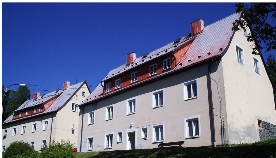
pohled ze severní strany

Dům č.p. 36 (zadní z obou domů) vlastní společenství vlastníků